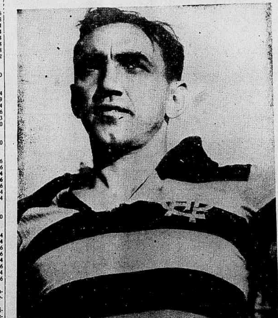
TOCAFUNDO, centro médio do Atlético

MESMO TIME ATLETICANO De princípio o técnico Mottorzinho não pretende modificar (Continua na 3.a página)