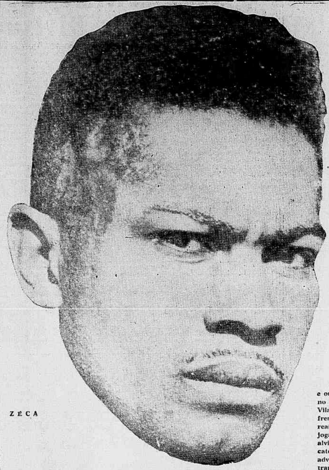
Z E C A

Ferrovário x Britânia Sábado na Vila Guaira; Operário x Caramurú Domingo em Ponta Grossa!