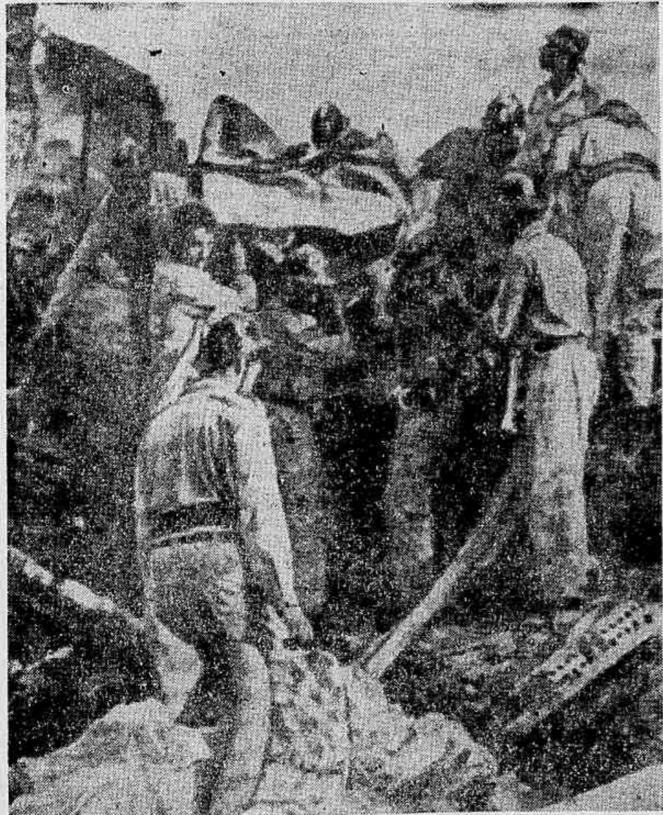
MORTE E DESTRUIÇÃO: — Quando os bombeiros lutavam insistentemente contra perigosas chamas é que advieram a catástrofe: primeiro ouviu-se uma surda explosão para em seguida o prédio ruir estrepitosamente, ceifando muitas vidas.