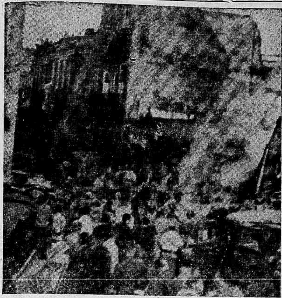
VISÃO DO DESABAMENTO: — A população da Rua Buenos Aires viveu horas de intensa emoção com a tragédia do incêndio, explosão e desabamento de um edifício, conforme já noticiamos em primeira mão no CORREIO DO PARANÁ, pois o sinistro, por vezes, esteve para se alastrar e causar um desastre de grandes proporções. Não foram poucos os habitantes das cercanias que deixaram seus lares com os objetos mais valiosos, temerosos que estavam de que a tragédia pudesse ser maior. Pessoas e bombeiros perderam a vida, soterradas, queimadas ou lutando para conseguir salvar o grande número de seres que se encontravam soterrados. O desastre levou luto e desolação a dezenas de lares cariocas.