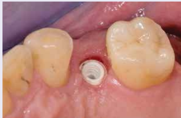
Abb. 21: Das freigelegte Implantat.