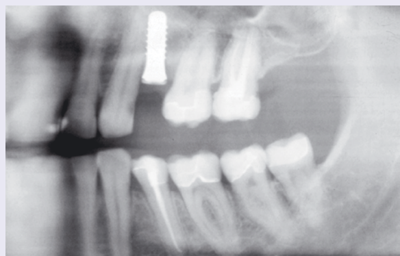
Abb. 2: OPG nach Implantatinsertion.