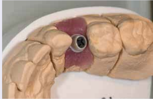
Abb. 11: Gut sichtbar: Die Schraube aus PEEK.