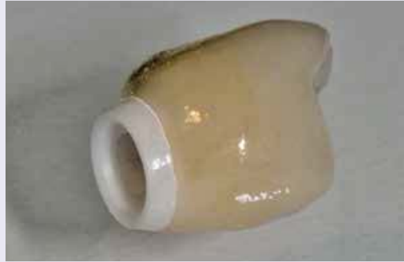
Abb. 19: Nach der Politur der Klebefuge.