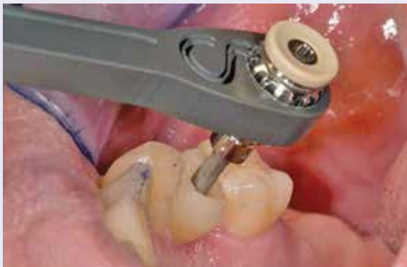
Abb. 22: Die VIRCABO®-Schraube wird mit 25 bis 35 Ncm verschraubt.