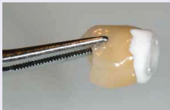
Abb. 17: Die Überschüsse werden mit Watte- oder Schaumstoffpellet entfernt.