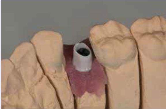
Abb. 10: Aufgeschraubtes und individualisiertes Abutment auf Modell.