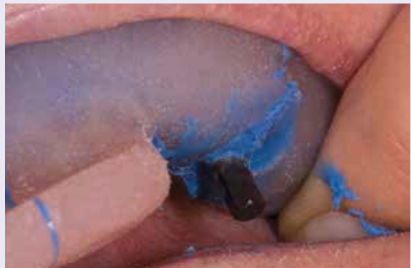
Abb. 6: Offene Abformung mit individuellem Löffel.