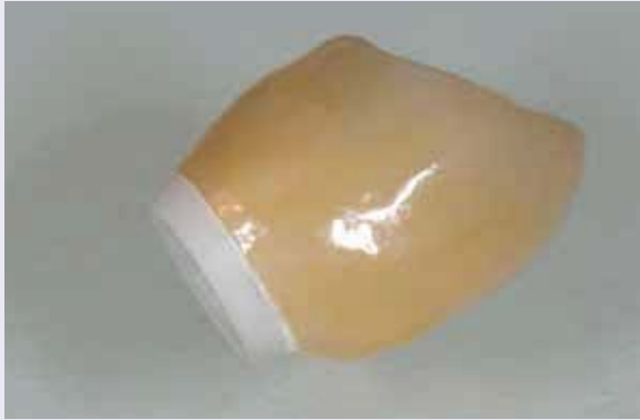
Abb. 18: Die verklebte Krone.