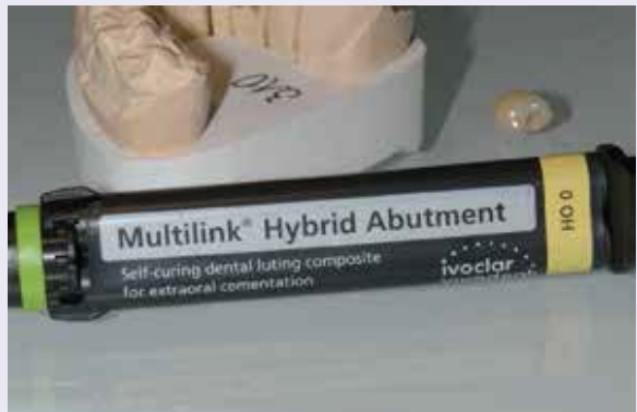
Abb. 15: Zum Verkleben der Krone mit dem Abutment wird Multilink® Hybrid Abutment (Ivoclar Vivadent) verwendet.