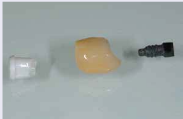
Abb. 13: Die Einzelteile: Abutment, Krone und Schraube.