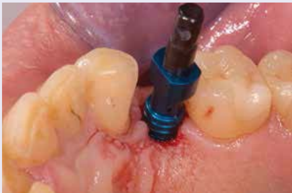
Abb. 5: Aufgeschraubter Abdruckpfosten.