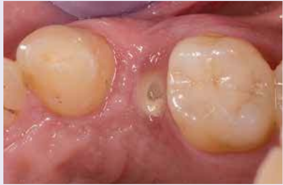
Abb. 4: Nach dreimonatiger Einheilphase.