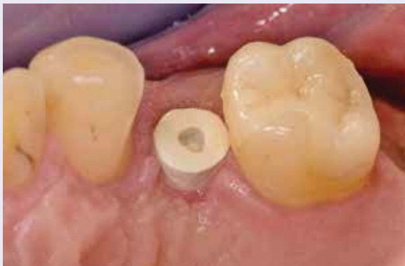
Abb. 20: Situation im Mund nach zwei Wochen Ausformung mit einem Gingivaformer.