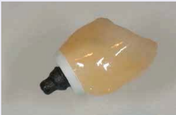
Abb. 14: Die zusammengesetzten Einzelteile.