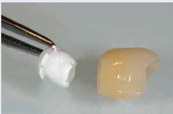
Abb. 16: Der weiße Kleber wird auf das Abutment aufgetragen.