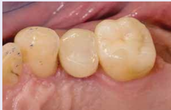
Abb. 23: Der Schraubenkanal wird mit Komposit verschlossen.