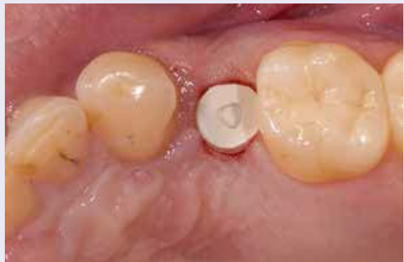
Abb. 8: Eingesetzter Gingivaformer.