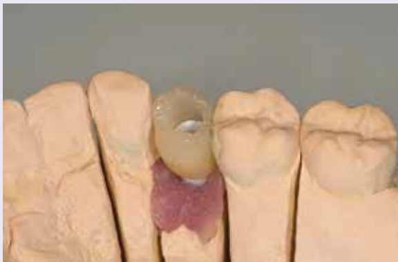
Abb. 12: Die aufgesetzte fertige Krone aus e.max (Ivoclar Vivadent).