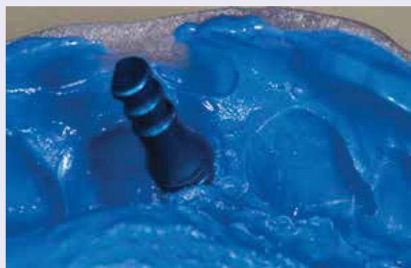
Abb. 9: Aufgeschraubtes Laboranalog vor der Modellherstellung im Abdruck.