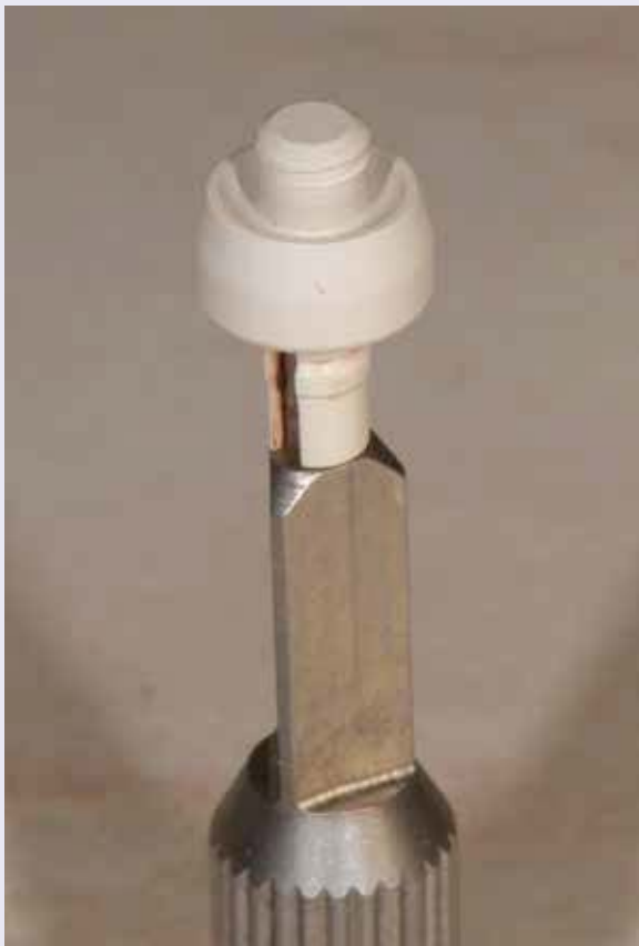
Abb. 7: Einschraubbarer Gingivaformer.