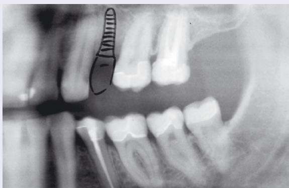
Abb. 1: OPG vor Behandlungsbeginn und Implantatplanung.

Bei einem 52-jährigen Patienten musste der Zahn 24 nach erfolgloser Nervkanalbehandlung und Wurzelspitzenresektion extrahiert werden. Nach fünf Monaten war der Knochen soweit ausgeheilt, dass ein Implantat inseriert werden konnte. Der Patient entschied sich für ein metallfreies Implantat. Es wurde ein Zeramex® P Implantat ausgewählt, bei dem eine verschraubte und damit auswechselbare Supraverversorgung möglich ist. Abbildung 3 zeigt nach Verlust von Zahn 27 bereits die Planung zweier weiterer Implantate. Falls Zahn 26 irgendwann verloren gehen sollte, kann leicht eine Brücke auf die vorhandenen Implantate gesetzt werden.