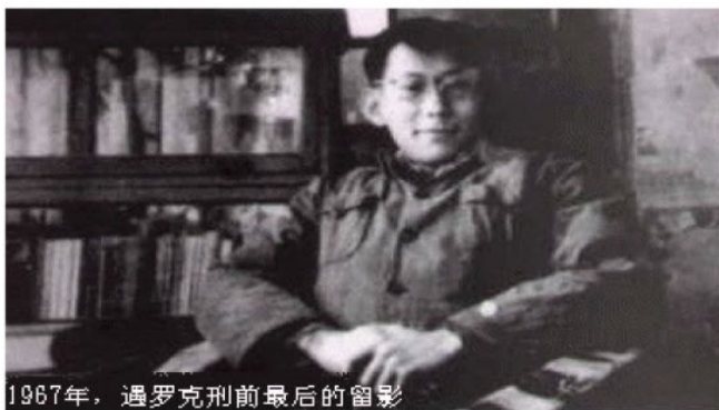
1967年，遇罗克刑前最后的留影

北京人民机械厂学徒工遇罗克，书写日记和批评文革，1970年3月5日被判处死刑枪决。