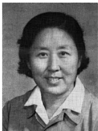
北京师范大学附属女子中学