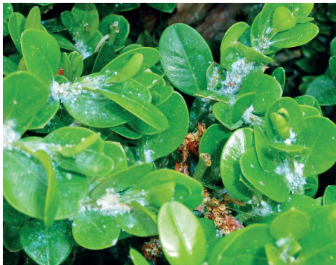
Abb. 3: Befall durch Buchsbaumfloh

Hinweis: Die mit den Blattläusen verwandten Blattflöhe haben ihren Namen von den zum Springen geeigneten, starken Hinterbeinen. Die überwinterten Larven besiedeln im Frühjahr die jungen Triebspitzen und saugen dort unter Abgabe großer Mengen Honigttau. Sie leben im eingerollten Blatt und werden durch die wachsartigen Ausscheidungen geschützt. Die erwachsenen Blattflöhe erscheinen Ende April/Anfang Mai und legen im Juni/Juli Eier hinter Knospenschuppen, aus denen noch im Herbst Larven schlüpfen. Es gibt nur eine Generation im Jahr.