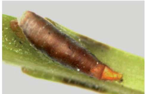
Abb. 9: Kommaschildlaus an Buchsbaum

Schadbild: An Blättern und jungen Trieben befinden sich kommaförmige, braune Schildläuse. Durch eine intensive Saugtätigkeit sterben die Zellen der Blätter ab und werden gelb. Über mehrere Jahre kann sich eine sehr starke Population aufbauen. Bei sehr starkem Befall kommt es zum Triebsterben am Buchsbaum. Honigtau wird nicht gebildet. Diese Schildlausart kann auch an anderen Gehölzen auffällig werden.