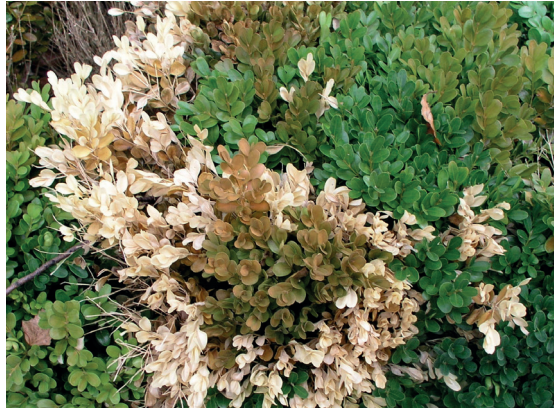
Abb. 2: absterbender Buchsbaum durch Buchsbaumkrebs

Gegenmaßnahmen: Abgestorbenes Material und erkrankte Pflanzen sollten schnellstmöglich entfernt werden. Bei wiederholtem Auftreten an feuchten Standorten oder bei einer regelmäßigen Bewässerung über Kopf ist die Pflanzung durch andere Arten zu ersetzen. Zugelassene PSM sind der Tabelle zu entnehmen.