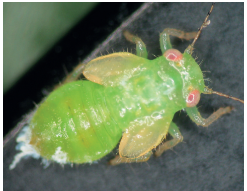
Abb. 4: Larve des Buchsbaumfloh