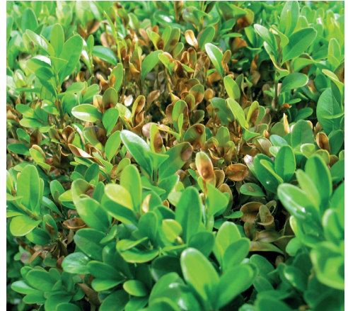
Abb. 1: Buchsbaumtriebsterben-Blattsymptome

Hinweis: Der Pilz hat sich in den vergangenen Jahren sehr stark ausgebreitet. Er benötigt keine Wunden um in die Blätter einzudringen und eine Infektion auszulösen. Zur Infektion sind Temperaturen über 15 °C und Blattnässe über mehrere Stunden erforderlich. Empfindlich ist vor allem die für die Beeteinfassung verwendete niedrigwachsende Sorte ‚Suffruticosa‘.