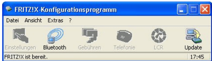
Hauptfenster des Konfigurationsprogramms „FRITZ!X“

Über die Schaltflächen „Bluetooth“ und „Update“ stehen Ihnen die wichtigsten Funktionen des Konfigurationsprogramms zur Verfügung. Detaillierte Informationen finden Sie in der Online-Hilfe.