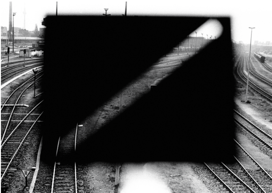
Ohne Titel , 1994 Berlin Serie: Westhafen