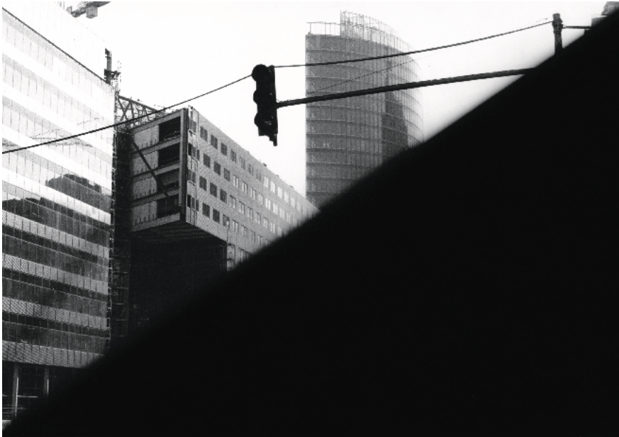
Ohne Titel , 1997 Berlin Serie: Potsdamer Platz