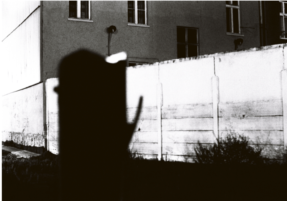
Ohne Titel , 1990 Berlin Serie: Bernauer Straße, Berliner Mauer