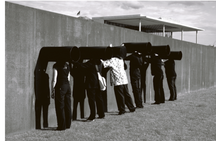
Röhrenmenschen , 2005 Berlin Serie: Die Röhrenmenschen