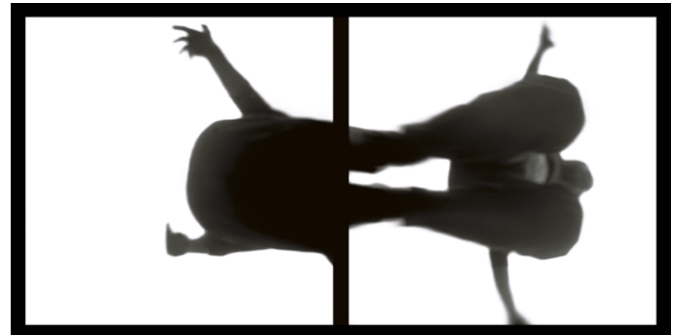
Überspringen, 1985 Babelsberg Serie: Überspringen

Ich bin derjenige zwischen Jetzt, Jetzt und Jetzt Ich Unterliege dem Zeitregime. Ich bin derjenige zwischen Hier, Hier und Hier Ich unterliege dem Raumregime. Ich bin derjenige zwischen Geburt und Tod, 1984 Berlin