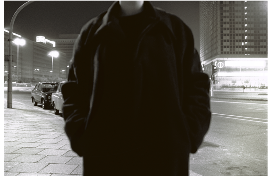
Null Uhr, 1986 Alexanderplatz, Berlin Serie: Nacht