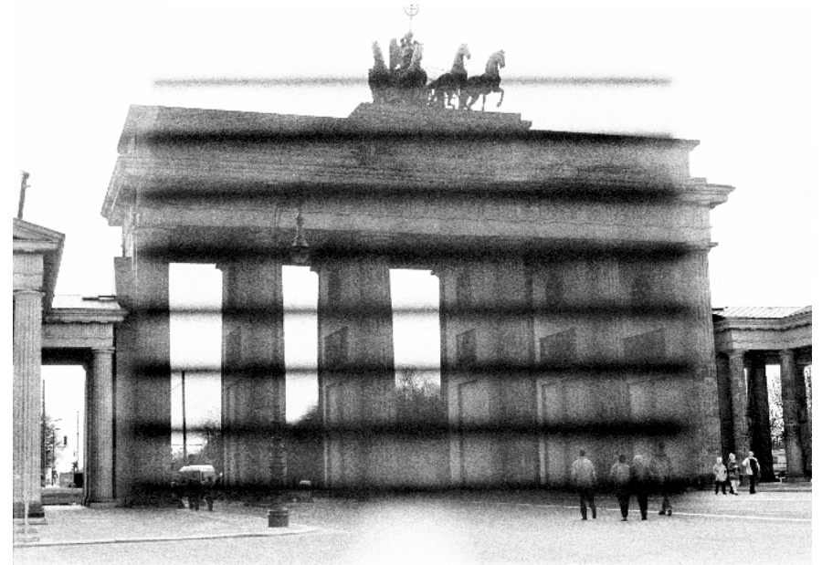
Brandenburger Tor , 1994 Berlin Serie: End of History