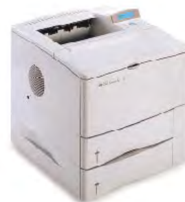
HP LaserJet 4000 T HP LaserJet 4000 TN