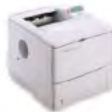
HP LaserJet 4000 HP LaserJet 4000 N

JetAdmin und WebJetAdmin sowie HP PCL 6 und PostScript Level 2 Emulation sind standardmäßig im Lieferumfang enthalten und erlauben eine leichte Netzwerkinstallation und -verwaltung; dies senkt die Kosten für aufwendige Support- und Wartungsarbeiten.