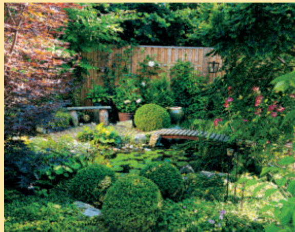
Vom Sitzplatz am Teich kann man gut die Pflanzen und Tiere am Ufer beobachten. Heft 5