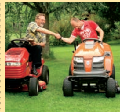
Das Traktoren-Rennen. Wer wurde Sieger im großen Aufsitzmäher-Test? Antworten im Juni-Heft