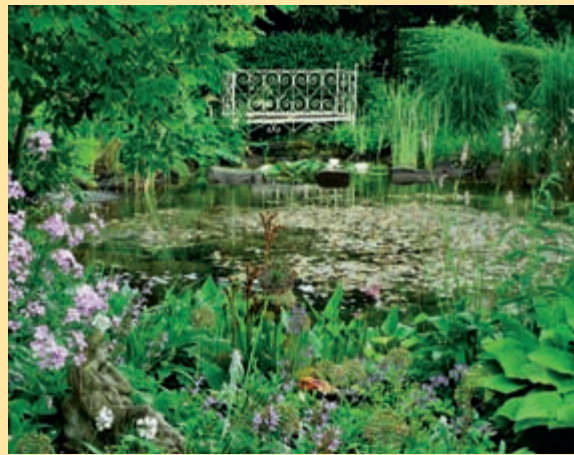
Traumhaft schöne Biotope. Gartenteich-Ideen zum Nachmachen. Pflanzpläne und mehr im Heft Mai