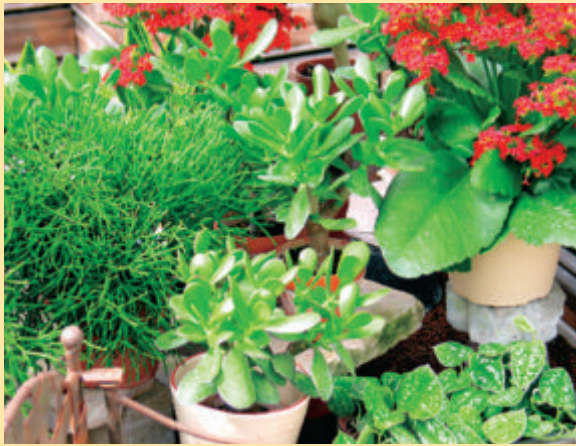
Blattsukkulente mit wasserspeichernden Blättern haben sich an trockene Standorte angepaßt. Heft 11