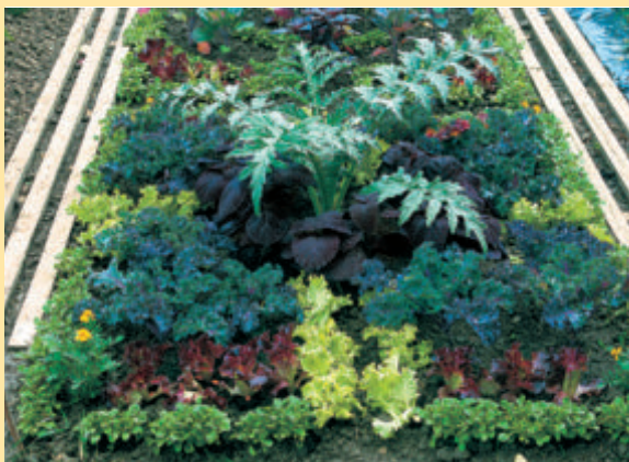
Geschmackvolle Mischkultur verschiedener Gemüsearten. Heft 9