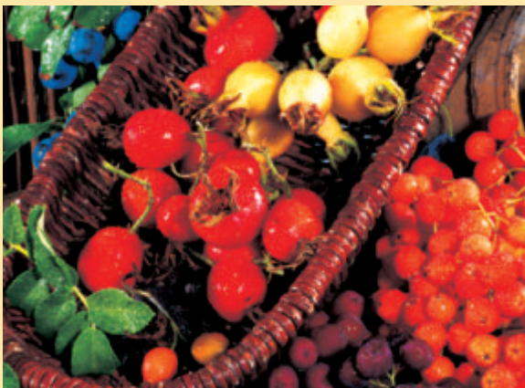
Hagebutten und andere Wildfrüchte beleben im Herbst den Garten. Heft 9