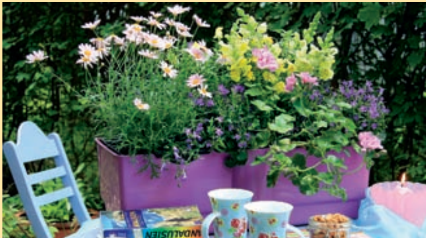
Neue Blütenstars, schicke Blattschönheiten, aromatische Kräuter. Alles für den Balkon. Beitrag aus dem Heft 05/2010