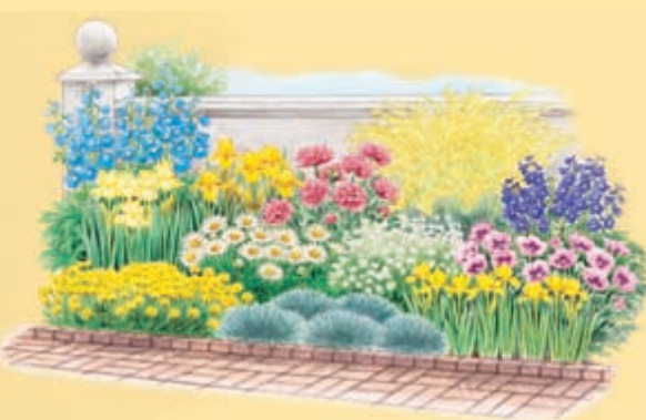
Rosa und Gelb? Passt das wirklich zueinander? Einblicke in die Lehre von den Gartenfarben finden Sie in unserer September-Ausgabe