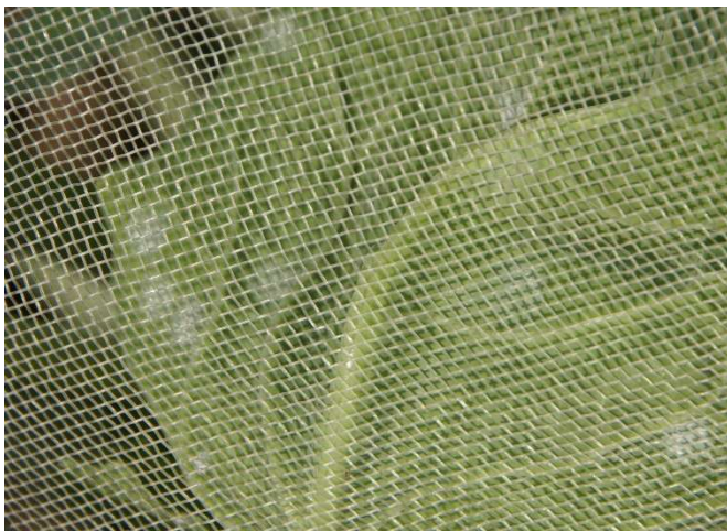
Abb. 18: Eiablage der Weissen Fliege an Rosenkohl unter einem Kulturschutznetz (mit 0.9 mm Maschenweite) im Spätsommer.

Zum Abhalten der Weissen Fliegen an Blumenkohl, Broccoli oder Wirz können feinmaschige Kulturschutznetze mit 0.5-0.8 mm Maschenweite verwendet werden. Frühzeitig eingesetzt, lässt sich der Befall zumindest bis in den August hinein auf einem relativ tiefen Niveau halten. Bei Bedarf ist der Netzeinsatz mit Pflanzenschutzmittel-Behandlungen zu kombinieren. In Kulturen mit langer Standzeit wie z.B. Rosenkohl ist die Wirksamkeit von Kulturschutznetzen unzureichend. Im Zuge der sommerlichen Massenvermehrung passieren vermehrt Weisse Fliegen die Netze (Abb. 18), so dass zwischen August und Oktober eine ähnlich starke Befallszunahme zu beobachten ist wie in ungedeckten Kulturen.