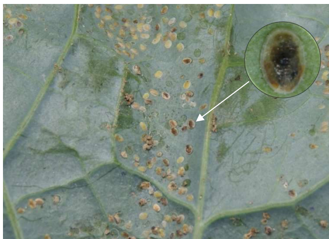
Abb. 21: Von der Schlupfwespe Encarsia tricolor parasitierte Weisse-Fliege-Larven verfärben sich dunkelbraun.