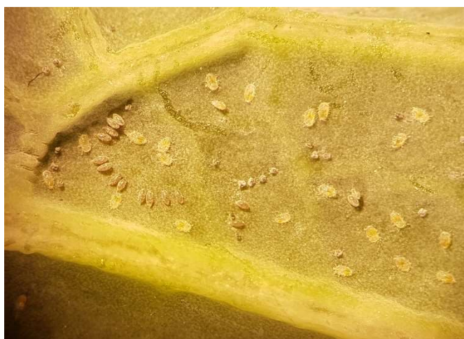
Abb. 22: Eier und frisch geschlüpfte Larven der Weissen Fliege an Kohl auf der Unterseite eines Wirzblattes.

Im Sinne des Resistenzmanagements sind bei aufeinanderfolgenden Behandlungen die Wirkstoffgruppen abzuwechseln. Pflanzenschutzmittel sollten aber auch gemäss ihrer Eigenschaften zum Einsatz kommen. So lässt sich mit einer kombinierten Applikationstechnik aus Feldbalken (Behandlung von oben) plus Spritzbeinen (Droplegs, Behandlung von unten) der Wirkungsgrad der Spritzapplikationen erhöhen – insbesondere bei Kontaktinsektiziden. Dank der Spritzbeine wird mehr Pflanzenschutzmittel an den Blattunterseiten angelagert, wo der Grossteil der saugenden Adulten und Larven der Weissen Fliege an Kohl sitzt.