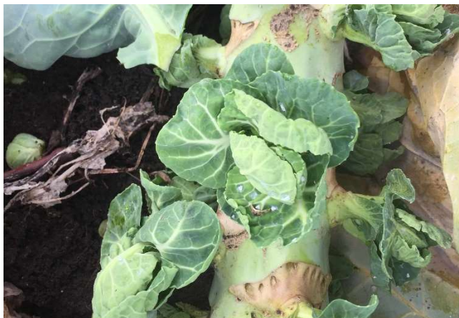
Abb. 16: Weisse Fliegen an einem nicht eingearbeiteten Strunk von Rosenkohl im Spätwinter.

Bis zur Erntereife haben sich an den Kohlkulturen im Sommerhalbjahr häufig stattliche Populationen von Weissen Fliegen entwickelt. Aber auch an überwinterten Kulturen tritt der Schädling häufig in grosser Anzahl auf. Daher sollten sämtliche Kohlkulturen, die abgeerntet sind, möglichst rasch nach dem letzten Erntegang zerkleinert und oberflächlich eingearbeitet werden (Abb. 16). Dies schliesst auch Rüstabfälle mit ein. Unkräuter wie Gänse Distel-Arten ( Sonchus spp.) zählen ebenfalls zu den Wirtspflanzen der Weissen Fliege an Kohl und sind möglichst zu eliminieren.