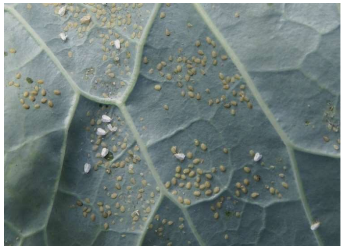
Abb. 8: Letzte Larvenstadien und Puparien der Weissen Fliege an Kohl und erste, daraus schlüpfende Adulte auf der Unterseite eines Rosenkohlblattes.

Die Entwicklungsgeschwindigkeit der Weissen Fliege an Kohl wird massgeblich von der Temperatur beeinflusst. In den Sommermonaten beträgt die Entwicklungsdauer vom Ei bis zum adulten Insekt etwa vier Wochen (Abb. 7, 8). In Jahren mit sehr warmen Sommern kann es im Kohlanbau bereits ab Juni oder Juli zu Massenvermehrungen kommen (Abb. 9). In der Deutschschweiz werden in solchen Jahren von Vorsommer bis Spätherbst, statt der üblichen vier bis fünf, bis zu sechs Generationen der Weissen Fliege an Kohl gebildet.