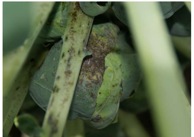
Abb. 12: Im weiteren Befallsverlauf kommt es zur Bildung von Russtau z.B. auf den Blattstängeln und den Röschen von Rosenkohl.