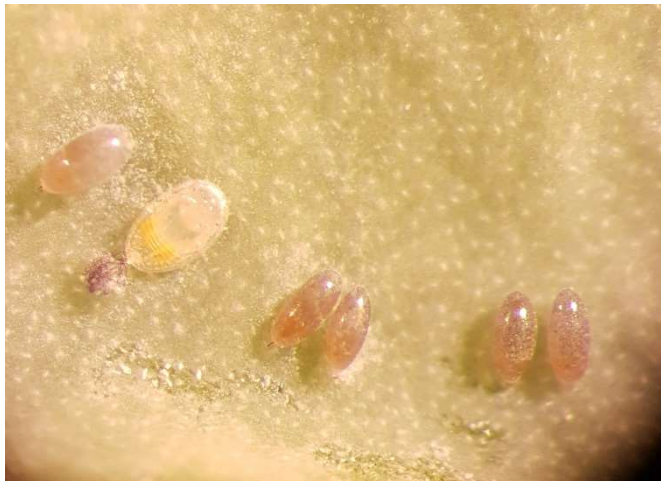
Abb. 4: Eier und eine geschlüpfte Larve der Weissen Fliege an einem Wirzblatt.