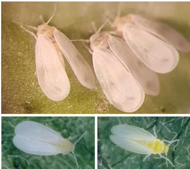
Abb. 1: Weisse Fliegen an Kohl (Kohlmottenschildläuse – Aleyrodes proletella , oben), Gewächshausmottenschildlaus ( Trialeurodes vaporariorum , links unten) und Baumwollmottenschildlaus ( Bemisia tabaci , rechts unten).

Mit etwa 1.5–2 mm Länge ist die Weisse Fliege an Kohl – die sogenannte Kohlmottenschildlaus ( Aleyrodes proletella ) – etwas grösser als die beiden anderen Weisse-Fliege-Arten, die im Gewächshaus bei uns vorkommen. Im Unterschied zu diesen, trägt die Kohlmottenschildlaus im hinteren Teil der Flügel blassgraue Flecken (Abb. 1).