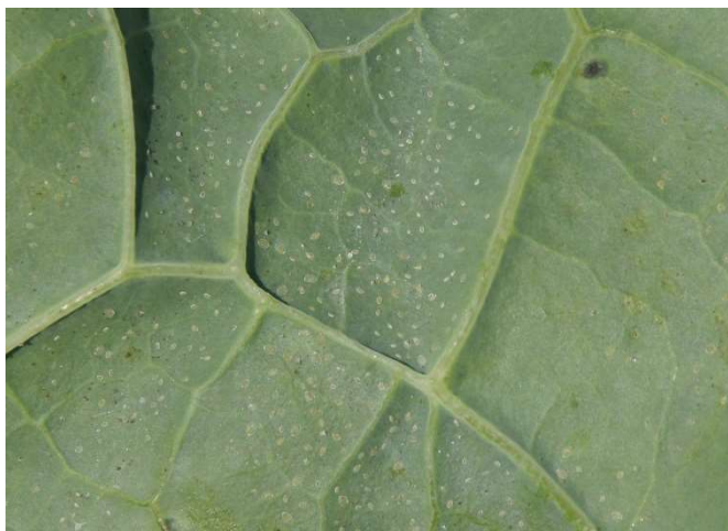
Abb. 6: Verschieden alte Larvenstadien der Weissen Fliege an Kohl auf der Unterseite eines Rosenkohlblattes.

Die aus den Eiern schlüpfenden, schildlausähnlichen Larven sind oval und weiss-gelb bis beige gefärbt. Nur das erste Larvenstadium besitzt Beine, ist mobil und setzt sich in einiger Entfernung vom Eiablageort auf der Unterseite des betroffenen Blattes fest (Abb. 5).