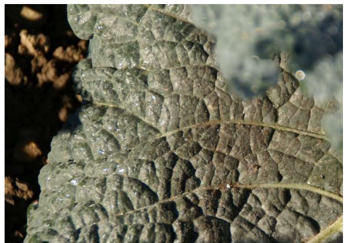
Abb. 13: Russtaubelag auf einer der unteren Blattoberseiten einer Wirtspflanze durch Befall mit Weissen Fliegen.

Im Zuge der Massenvermehrung des Schädlings werden Blätter und Röschen vom klebrigen Honigtau überzogen. Anschliessend siedeln sich innerhalb weniger Tage schwärzliche Russtaupilze darauf an (Abb. 12, 13), was die Qualität des Ernteproduktes mindert und den Putzaufwand erhöht.