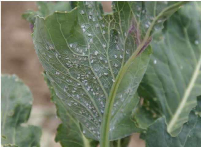
Abb. 9: Massenvermehrung der Weissen Fliege an Blumenkohl im Vorsommer.

Adulte Weibchen der letzten Generation überdauern und können in milden Wintern ab 10 °C bei der Eiablage beobachtet werden (Abb. 10). Im späteren Frühjahr siedeln ihre Nachkommen von den überwinterten Beständen auf junge Kohlkulturen über. Erreichen die Tagesdurchschnittstemperaturen regelmässig mindestens 16 °C, so herrschen für den Schädling gute Entwicklungsbedingungen. Entsprechend beginnt der Populationsaufbau im Schweizer Mittelland im Sommerhalbjahr in der zweiten Maihälfte oder spätestens im Juni.