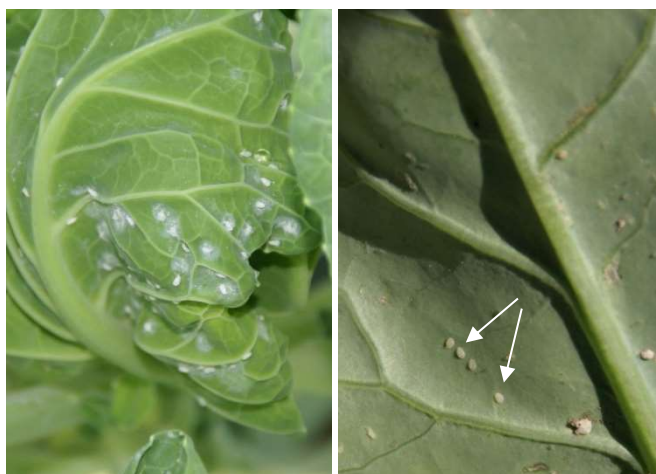
Abb. 17: Adulte Weisse Fliegen und ihre Eigelege an einem Herzblatt von Rosenkohl und erste Larven der Weissen Fliege (siehe Pfeile) an einem der unteren Blätter von Broccoli.

Für die Überwachung der Weissen Fliege an Kohl werden Kulturkontrollen empfohlen. Das Monitoring der Adulten mit Hilfe gelber Klebefallen hat sich als wenig praktikabel erwiesen. Adulte Weisse Fliegen und ihre Eigelege sind auf den jüngsten, frei zugänglichen Blättern und Seitentrieben einer Pflanze zu finden (Abb. 17). Die Larven bleiben auf den Blättern, auf denen sie als Eier abgelegt wurden. Entsprechend befinden sich am Ende einer Weisse-Fliege-Generation die ältesten Larven auf den älteren Blättern der befallenen Pflanze.