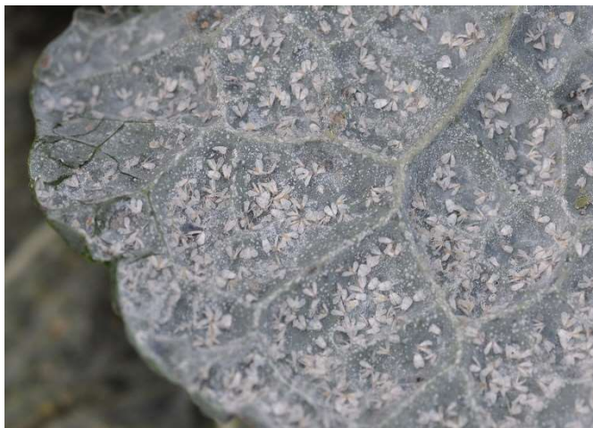
Abb. 14: Der Besatz mit Weissen Fliegen macht Blattgemüse wie Wirz unverkäuflich.

Ware mit sichtbaren Weissen Fliegen ist ebenso problematisch und wird im Verkauf nicht toleriert (Abb. 14).