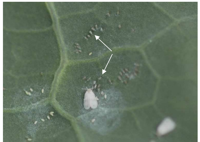
Abb. 3: Frische Eier der Weissen Fliege an Kohl sind weisslich und mit Wachsstaub überzogen. Im Zuge der Eireifung verfärben sie sich dunkler (siehe Pfeile).