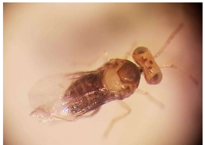
Abb. 20: Die Schlupfwespe Encarsia tricolor ist heimisch und kann im Spätsommer in Kohlbeständen stärker auftreten.

Da Schwebfliegen-Larven relativ ortstreu sind, durchlaufen sie die Larven- und Puppenentwicklung meist auf der Pflanze, auf der sie als Ei abgelegt wurden. Entsprechend befinden sich Schwebfliegen-Larven und -Puppen im Spätsommer und Frühherbst häufiger am Erntegut (Abb. 19). Obwohl es sich dabei um Nützlinge handelt, werden diese z.T. als Fremdbesatz angesehen und vom Handel nicht immer toleriert. Bei starkem Auftreten der Schwebfliegen-Larven und weiterer Nützlinge, wie beispielsweise der Schlupfwespe Encarsia tricolor (Abb. 20, 21), kann es im August oder September zu einem vorübergehenden Rückgang der Weisse-Fliege-Population kommen. Ein kompletter Zusammenbruch der Schädlingspopulation ist dennoch nicht zu erwarten.