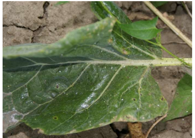
Abb. 11: Glänzender Belag aus Honigtau auf der unteren Blattoberseite einer Rosenkohlpflanze durch Befall mit Weissen Fliegen.

Wie Blattläuse gehören auch die Weissen Fliegen an Kohl zu den Pflanzensäugern. Adulte und Larven stechen die Siebröhren an und nehmen Pflanzensaft auf. Überschüssige Flüssigkeit und Zucker werden von ihnen als sogenannter Honigtau wieder ausgeschieden (Abb. 11).