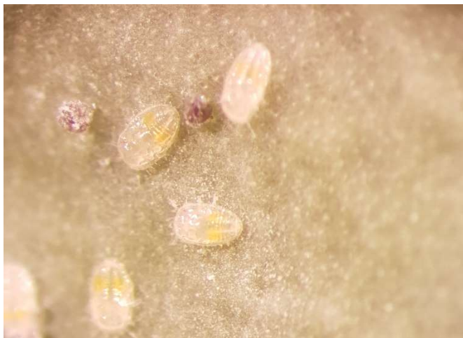
Abb. 5: Das erste Larvenstadium der Weissen Fliege an Kohl ist mobil und wird daher auch als «Crawler» bezeichnet.

Die aus den Eiern schlüpfenden, schildlausähnlichen Larven sind oval und weiss-gelb bis beige gefärbt. Nur das erste Larvenstadium besitzt Beine, ist mobil und setzt sich in einiger Entfernung vom Eiablageort auf der Unterseite des betroffenen Blattes fest (Abb. 5).