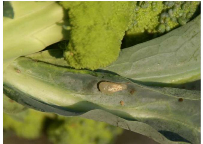
Abb. 19: Frisch verpuppte Larve einer Hainschwebfliege am Umblatt eines geernteten Broccolis.

Ab Juni oder Juli treten in den Kohlbeständen die Larven heimischer Schwebfliegen-Arten, wie z.B. der Hainschwebfliege ( Episyrphus balteatus ) und der Langbauchschwebfliege ( Sphaerophoria scripta ) auf. Die Schwebfliegen-Larven leben räuberisch und ernähren sich u.a. von Eiern und Larven der Weissen Fliege an Kohl.