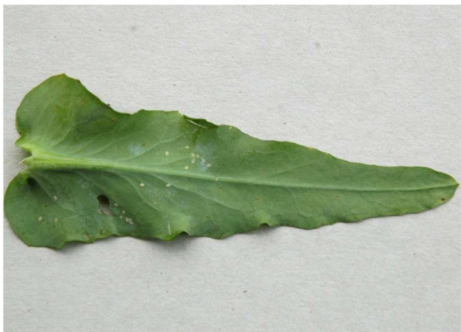
Abb. 15: Auch Raps zählt zu den Wirtspflanzen der Weissen Fliege an Kohl.

In Gebieten mit ganzjährigem Kohlanbau sollten junge Frühjahrskulturen möglichst weit entfernt zu überwinterten Beständen von Kohl und Raps platziert werden, um die Neubesiedlung der frischen Pflanzungen so lange wie möglich hinauszuzögern. Es ist davon auszugehen, dass die Weissen Fliegen an Kohl über Distanzen von mindestens 1 km mit dem Wind von einer befallenen Kultur auf eine neue verfrachtet werden können.