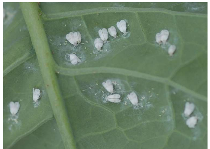
Abb. 2: Weisse Fliegen an Kohl bei der Eiablage auf der Unterseite eines Rosenkohlblattes.

Diese sogenannten Eigelege sind oft mit Wachsstaub überzogen. Im Zuge der Reifung verfärben sich die Eier dunkler (Abb. 3, 4).