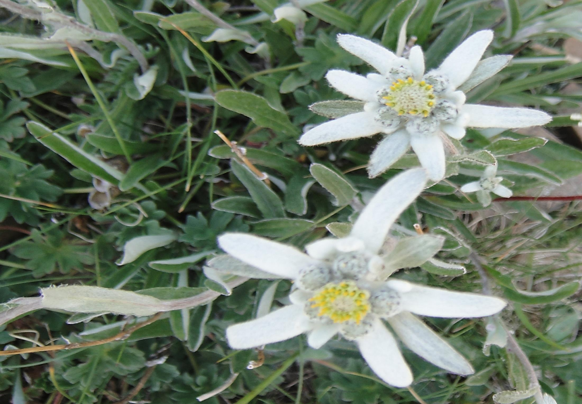
La cumbre nos gratifica con la hermosa “Edelweiss”, difícil de ver en Ordesa.