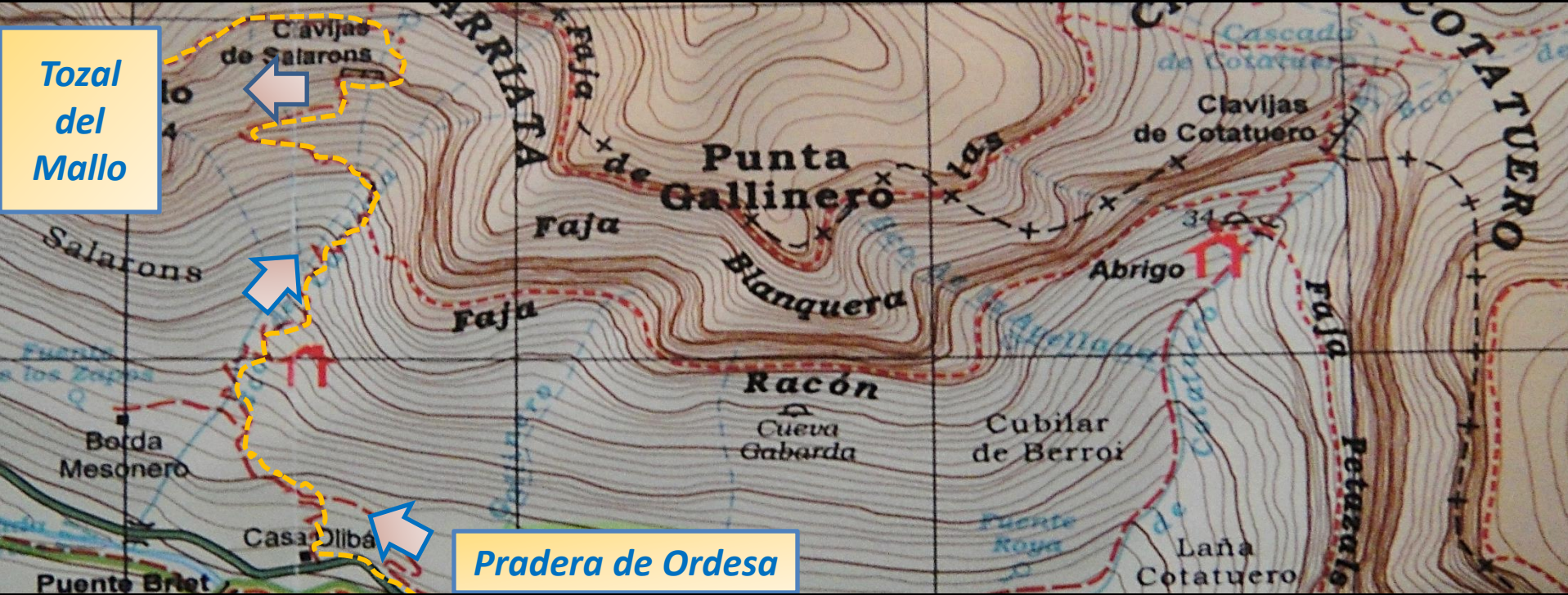
Mapa topográfico escala 1:40.000