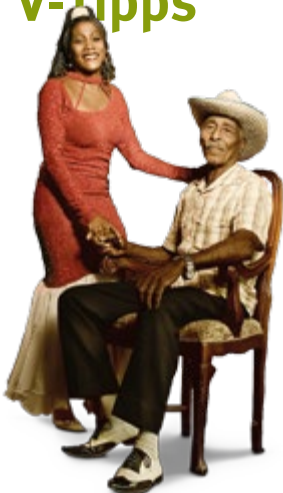
Das Ensemble von Pasi3n de Buena Vista gastiert in der Werner-Jaeger-Halle.