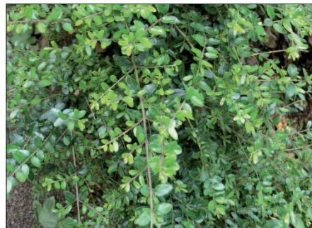
Heckenmyrte „ Lonicera nitida “