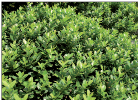
Japanstechpalme „ Ilex crenata “