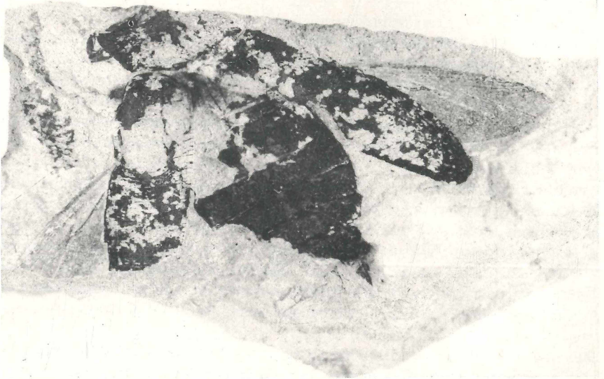
Abb. 2: Prachtkäfer (Buprestidae g. sp.) unvollständig. Länge 20-22 mm, Breite 10 mm. Rechte Flügeldecke genau 13,4 mm lang und 5,0 mm breit. Einordnung nach den gut erhaltenen Adern der teilweise erhaltenen Hautflügel.

Weniger unterschiedlich sind die Vorstellungen hinsichtlich der Pflanzenbedeckung der Umgebung. Straus nimmt das Bestehen eines dichten Urwaldes an, der nur durch die Pfade großer Säuger (Mastodon, Tapir, Hirsch - von jedem nur ein Beleg) unterbrochen worden sei. H. Schmidt plädiert jedoch für ein mehr offenes Gelände, das durch die Fraßtätigkeit der Großsäuger geschaffen und erhalten sein soll. Dieser Begründung für uneinheitlich bedecktes Gelände bedarf es kaum. Zumindest in unmittelbarer Nähe der Lagerstätte dürfte ein gut erhaltener flugunfähiger Schwarzkäfer gelebt haben, der entsprechend der Lebensweise seiner lebenden Verwandten nicht als Waldbewohner anzusehen ist. Auch die Weinbergzikade, die erhalten blieb, lebt nicht im Wald. Dasselbe gilt für die Heuschrecken, von denen eine neu beschriebene (!) Art Waldbewohner sein kann, die übrigen 11 aber sicher in unbeschattetem Gelände gelebt haben. Und schließlich dürften auch weiter entfernt von der Lagerstätte unbewaldete Bereiche vorhanden gewesen sein, dort, wo die Bodendecke nur dünn gewesen ist. Schließlich war der zweifellos auch vorhandene "Wald" damals kein Produkt der Forsttechnik mit gleichalten, von einer oder wenigen Holzarten gebildeten geschlossenen Beständen. Und darüber hinaus darf der Einzugsbereich der Lagerstätte als recht umfänglich angesehen werden.