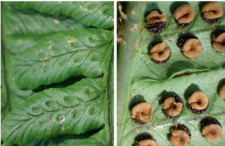
Abb. 35/233: Dryopteris affinis subsp. punctata . Makrofotos der Ober- und Unterseite der Fiederchen mit charakteristischen „Dellen“ und derben Indusien; Neunkirchner Höhe.

Neu für Hessen! Die Verwandtschaft von Dryopteris affinis bereitet erhebliche Bestimmungsprobleme. Die Form der Fiederchen, das derbe Indusium und die deltenartigen Mulden auf der Gegenseite der Sori (Blattoberseite) gelten aber als sehr charakteristisch für die hier mitgeteilte Unterart. Sie war in Deutschland bisher nur im Allgäu gefunden worden (Freigang & Zenner 2007, Ber. Bot. Arbeitsgem. Südwestdeutschland 4, 37–64). Im Odenwald kommen also alle aus Deutschland bekannten und gültig benannten Formen vor. Manche sind allerdings nur aus dem badischen Teil sicher nachgewiesen ( D. cambrensis , D. lacunosa : beide bei Heidelberg). Auch D. pseudodisjuncta ist sehr selten (Melibocus, Reisenbacher Grund). Die typische Unterart ( D. affinis subsp. affinis ) ist im Odenwald ebenfalls nicht häufig, aber weiter verbreitet, wobei der Verbreitungsschwerpunkt im Süden (Neckartal und Seitentäler) liegt. Öfters zu finden ist dagegen D. borrieri .