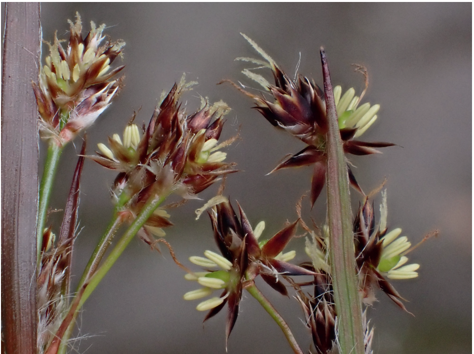
Abb. 35/255: Luzula multiflora (links) und L. divulgata im Vergleich; man beachte die Antheren- und Tepallänge; Bergstraße, Odenwald.

Pflanzen anderer Arten und Herkünfte wurde der Nachweis letztlich abgesichert. Verwendet wurden bergsträßer und „sichere“ L. divulgata aus Mitteldeutschland sowie zeitgleich blühender L. multiflora und L. campestris aus Wildvorkommen im Garten des Verfassers. Die Wuchsort an der Bergstraße lassen sich am ehesten als Habichtskaut-Traubeneichen-Wald (Hieracio-Querquetum) charakterisieren, in den exponiertesten Ausprägungen an der Orbishöhe auch als Potentillo-Querquetum. Dort kommen als Begleitarten Anthericum liliago , A. ramosum , Carex humilis und Calluna vulgaris dazu. Ergänzend wurden die Belege von Luzula multiflora im Herbarium Seckenbergianum (FR) durchgesehen. Unter Dutzenden Belegen sicherer L. multiflora fand sich einer, der zu L. divulgata gehört. Der Beleg wurde am 4. Mai 1954 von Karl Peter Buttler im bayerischen Vorspessart gesammelt, nämlich in der „Rückersbacher Schlucht“ nordöstlich Kleinostheim. Buttler hat den Beleg mit einem Vermerk versehen „( L. campestris ?) Staubblätter 2\frac{1}{2} \times s. l. wie Staubfäden!“. Er hatte also damals schon den richtigen Riecher bei der noch unbeschriebenen Art. Die Pflanzen wuchsen im Laubwald und waren häufig. Dies ist der erste Beleg der Art aus Nordwestbayern und ein starkes Indiz dafür, dass die Art weiter verbreitet ist.