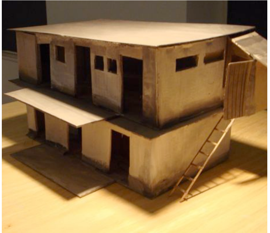
Ivan Bazak. Grenzstation. 2007. Holz, Pappe (bemalt), Leuchte. 51 x 33 x 25 m. Verschiedene Ansichten.